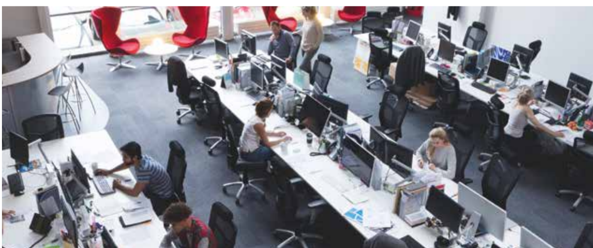
Büroflächen erweisen sich als krisenresistent.

Die Corona-Pandemie trifft nicht alle Segmente des Immobilienmarktes gleich stark.