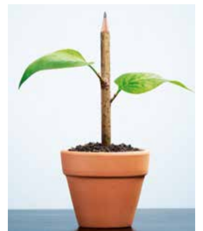
Sprout World: Stifte werden zu Bäumen.

Tatsächlich ist die Verwendung eines natürlichen Baumes noch immer die umweltfreundlichste Alternative – wenn man denn gar nicht auf die Tradition verzichten will. Wer wirklich nachhaltig Weihnachten feiern möchte, sucht sich einen möglichst lokalen Verkauf – auf robinwood.de finden sich Listen – von Bäumen mit Bio- und Fair-Trees-Siegel, schleppt das Nadelgewächs zu Fuß oder mit dem Rad nach Hause und heizt nach Weihnachten damit den Ofen. Die Gründe dafür: Fair Trees setzt sich für eine faire Bezahlung von Saat-