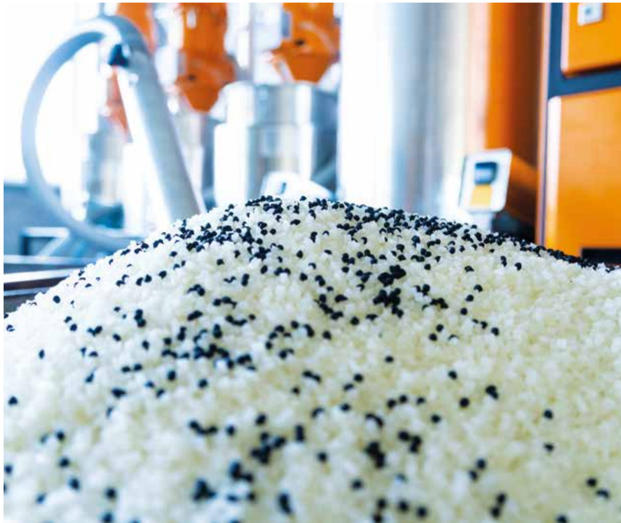
Wiederverwertung ist eines der wichtigsten Themen, wenn es um Nachhaltigkeit geht.