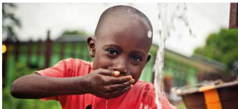
Sauberes Trinkwasser gehört zu den UN-Zielen für nachhaltige Entwicklung.