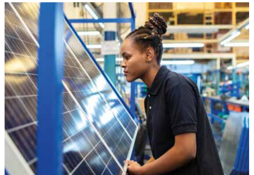
Private Equity ist oft in vielerlei Hinsicht nachhaltig ausgerichtet.

langfristige Entwicklung eines Unternehmens. Damit geht oftmals eine Verbesserung der Corporate Governance einher, weil Private Equity ein großes Interesse an einer klaren Trennung von Funktionen hat und somit Management-, Kontroll- und Reportingsysteme etabliert werden. Aber auch auf das S zählt eine Private-Equity-Beteiligung ein, weil Gesundheit und Sicherheit im Arbeitsumfeld im Fokus stehen, in Aus- und Weiterbildung genauso investiert wird wie in eine größere Diversität der Belegschaft. Entsprechend sinnvoll ist es für Anleger, sich unter ESG-Gesichtspunkten mit einem Private-Equity-Engagement auseinanderzusetzen.