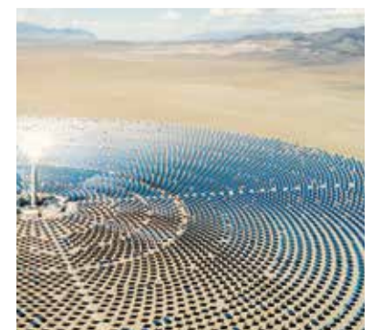
Nevada: Solarenergie aus der Wüste

Ein positiver Nebeneffekt: Die Investition in grüne Energien erfüllt alle Aspekte einer nachhaltigen, gesellschaftlich-sozialen und ökologischen Unternehmensführung.