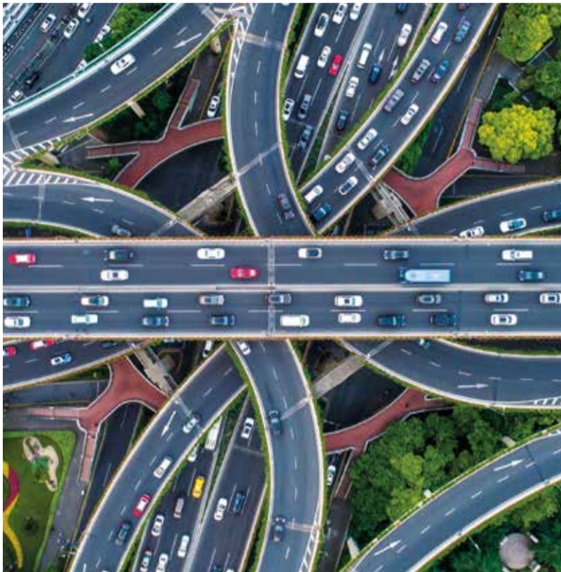
Der TS PE Pool II investiert mittelbar auch in Unternehmen des Infrastruktursegments.

Die Poollösung eröffnet den Zugang zum attraktiven Marktsegment Infrastruktur.