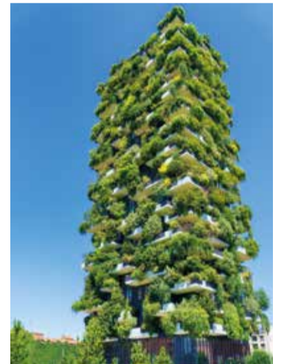
Der Trend: moderne Immobilienanlagen

Zumindest dürfte die Krise in einem Punkt für Klarheit sorgen: Wegen der Staatsschulden-Explosion rückt eine Zinswende im Euroraum in weite Ferne. Der Flucht aus traditionellen Anlagen in Richtung Immobilien und Alternatives wird das vermutlich keinen Abbruch tun.