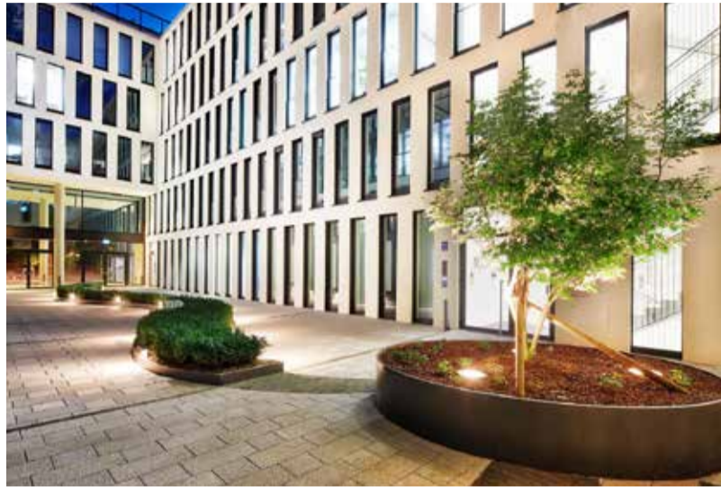
Das Arbeitsklima zählt – räumlich und menschlich

Die lichtdurchfluteten Büros in der neuen Firmenzentrale sorgen für eine kreative Atmosphäre, in der konzentriertes Arbeiten, Kommunikation und innovatives Denken gefördert werden. Angebote zu sportlichen Aktivitäten sowie gesundheitsfördernde Maßnahmen