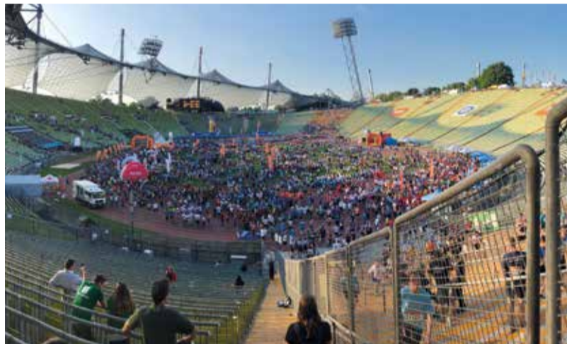
Großes Finale des B2Run-Firmenlaufs im Münchner Olympiastadion – auch BVT war mit einer engagierten Laufmannschaft vertreten.

ergänzen das Programm zur Nachhaltigkeit. Mit einem breit differenzierten Bildungsangebot bietet die BVT ihren Mitarbeitern attraktive Perspektiven für ihre berufliche Weiterentwicklung.