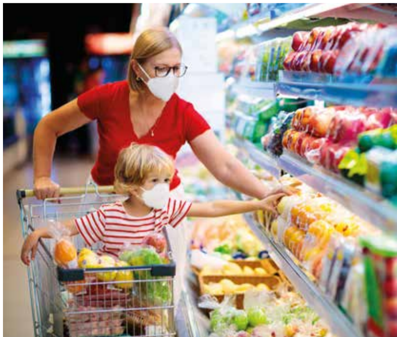
Der Einzelhandel für Güter des täglichen Bedarfs schlägt sich in der Krise tapfer.

Diese Strategie geht seit vielen Jahren für Anleger auf und hat sich gerade seit Jahresbeginn als krisenfest behauptet. Denn es sind vor allem Einzelhandelsflächen für Güter des sogenannten periodischen Bedarfs wie Mode und Textilien oder Elektronikartikel, die derzeit unter Druck stehen. Hier haben die zunächst generellen Ladenschließungen und anschließenden Beschränkungen zu Stundungen und sogar längerfristigen Reduzierungen von Vertragsmieten geführt.