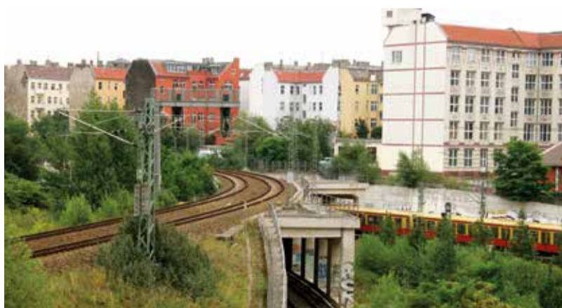
Den Berliner Wedding macht eine bunte Mischung der Kulturen attraktiv.

Die BVT eröffnet Investoren solche Beteiligungsangebote an der Entwicklung deutscher Immobilien im Rahmen individueller Co-